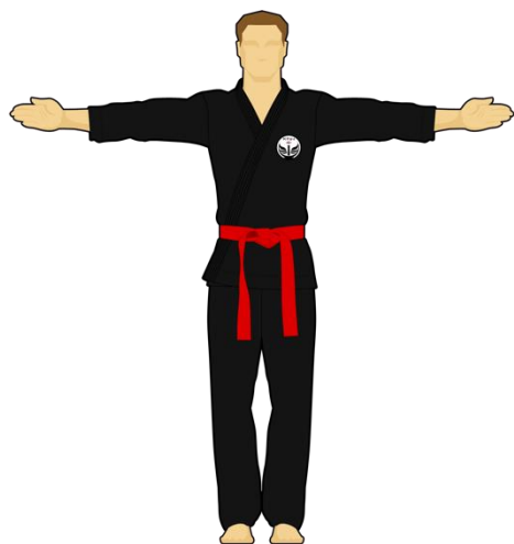
Schéma 1 : « Saluez-vous » ou « En Garde » ou « Saluez les arbitres »