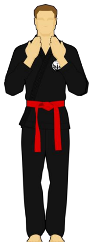
Schéma 5 : « Faute technique »