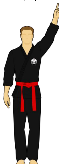
Schéma 8a : « Combattant rouge touche la cible A, 1 point »