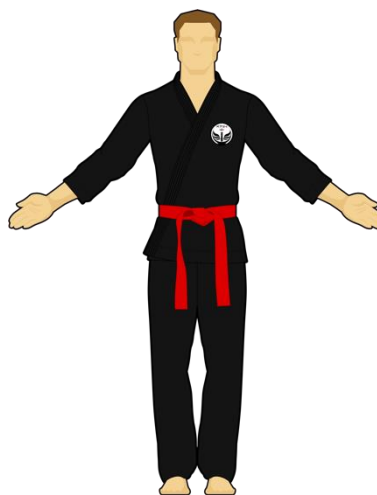
Schéma 2 : « Êtes-vous prêt ? »