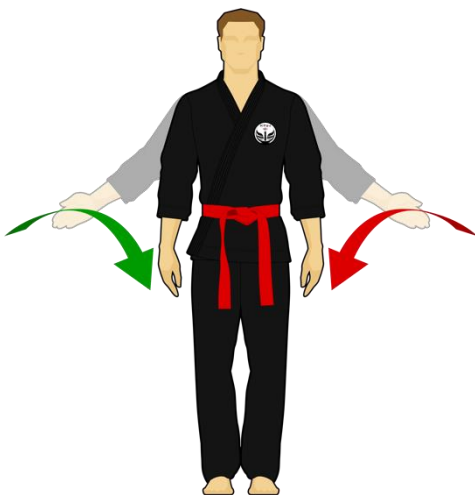
Schéma 3 : « Combattez »