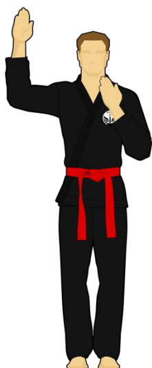
Schéma 13 : « Faute ! » Le combattant vert vient de faire une faute passible d'un avertissement ou d'une sanction.