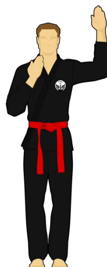
Schéma 14 : « Faute ! » Le combattant rouge vient de faire une faute passible d'un avertissement ou d'une sanction.