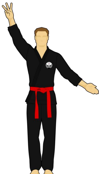
Schéma 11 : « Sortie de l'arène » Le combattant rouge est sorti de l'arène de combat en mettant les deux pieds dehors de façon intentionnelle. Les points reviennent au Combattant vert.