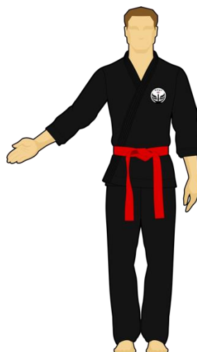
Schéma 10 : « Sortie de l'arène non intentionnelle » Le combattant vert est sorti de l'arène de combat en mettant les deux pieds dehors de façon non intentionnelle (bousculade).