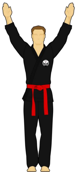
Schéma 15 : « Cessez ! »

L'arbitre demande l'arrêt du combat. Il peut s'ensuivre d'autres gestes d'arbitrage pour expliquer l'arrêt.