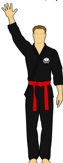
Schéma 7c : « Combattant vert touche la cible C, 5 points »