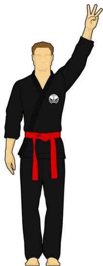
Schéma 8b : « Combattant rouge touche la cible B, 3 points »