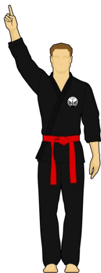
Schéma 7a : « Combattant vert touche la cible A, 1 point »