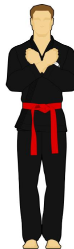
Schéma 4 : « Abstention », indécision de l'arbitre. Il n'a pas vu la faute ou la touche