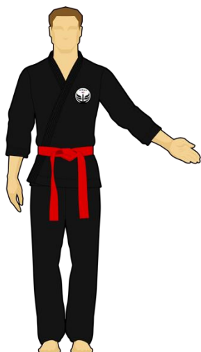
Schéma 9 : « Sortie de l'arène non intentionnelle » Le combattant rouge est sorti de l'arène de combat en mettant les deux pieds dehors de façon non intentionnelle (bousculade).