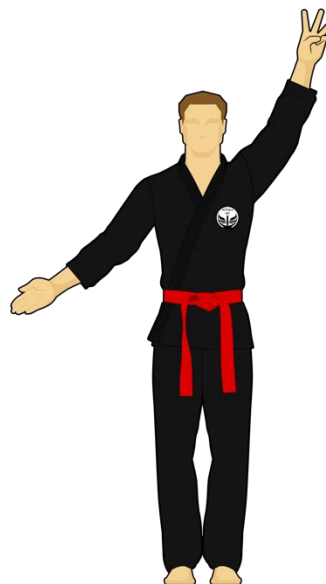
Schéma 12 : « Sortie de l'arène » Le combattant vert est sorti de l'arène de combat en mettant les deux pieds dehors de façon intentionnelle. Les points reviennent au Combattant rouge.