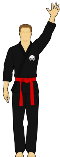
Schéma 8c : « Combattant rouge touche la cible C, 5 points »