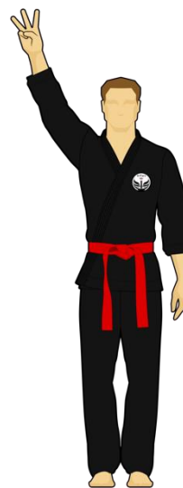
Schéma 7b : « Combattant vert touche la cible B, 3 points »